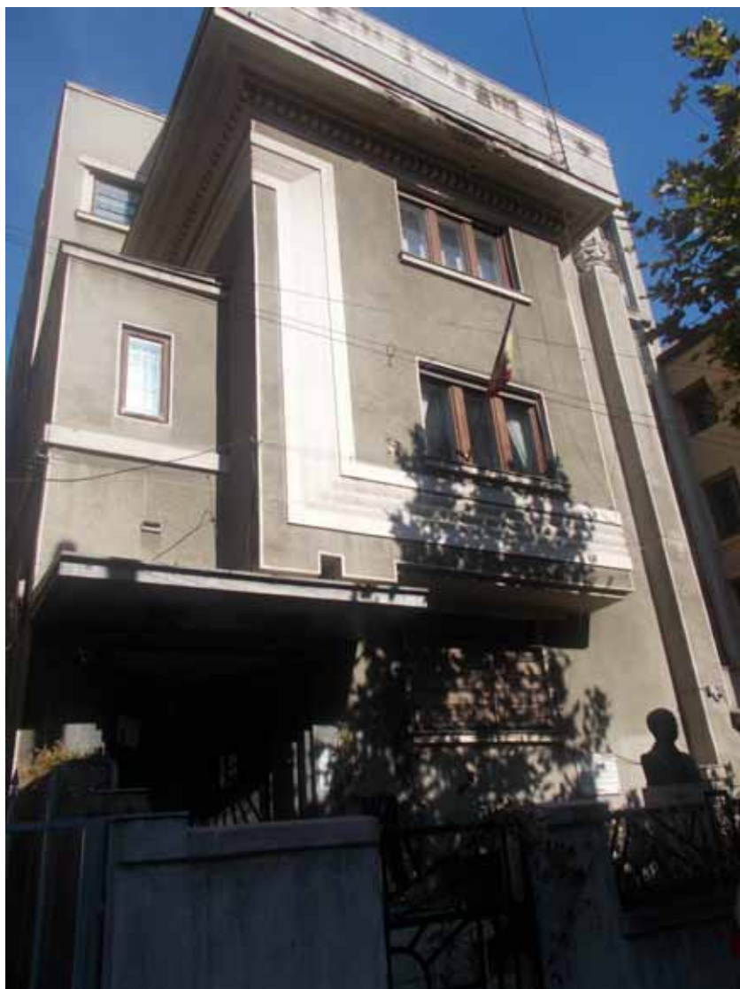
Fig. 1. Muzeul C. I. și C. C. Nottara, vedere de pe B-dul Dacia