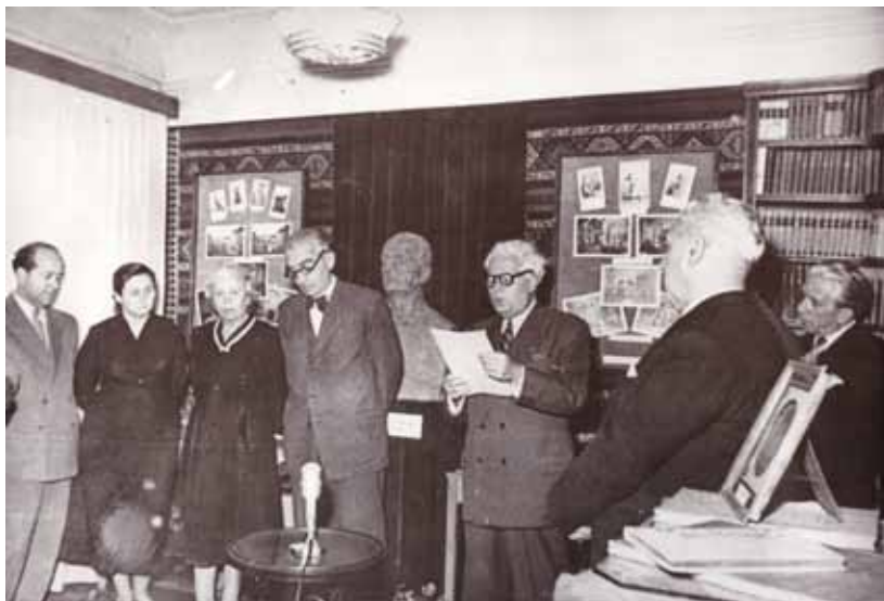
Fig. 3. Deschiderea oficială a Muzeului C. I. și C. C. Nottara (1956)