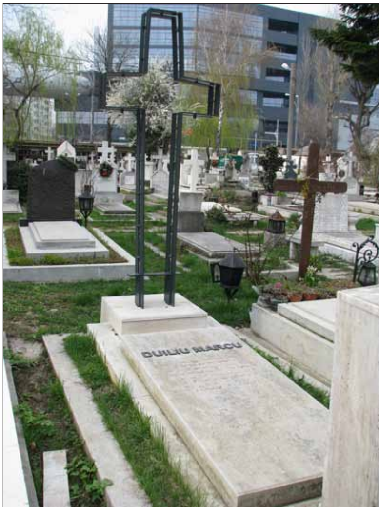
Fig. 20. Mormântul lui Duiliu Marcu