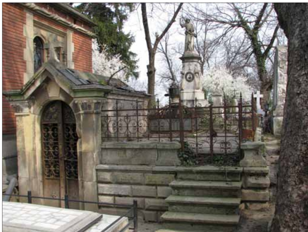
Fig. 8. Cavoul unde odihnește Constantin Băicoianu