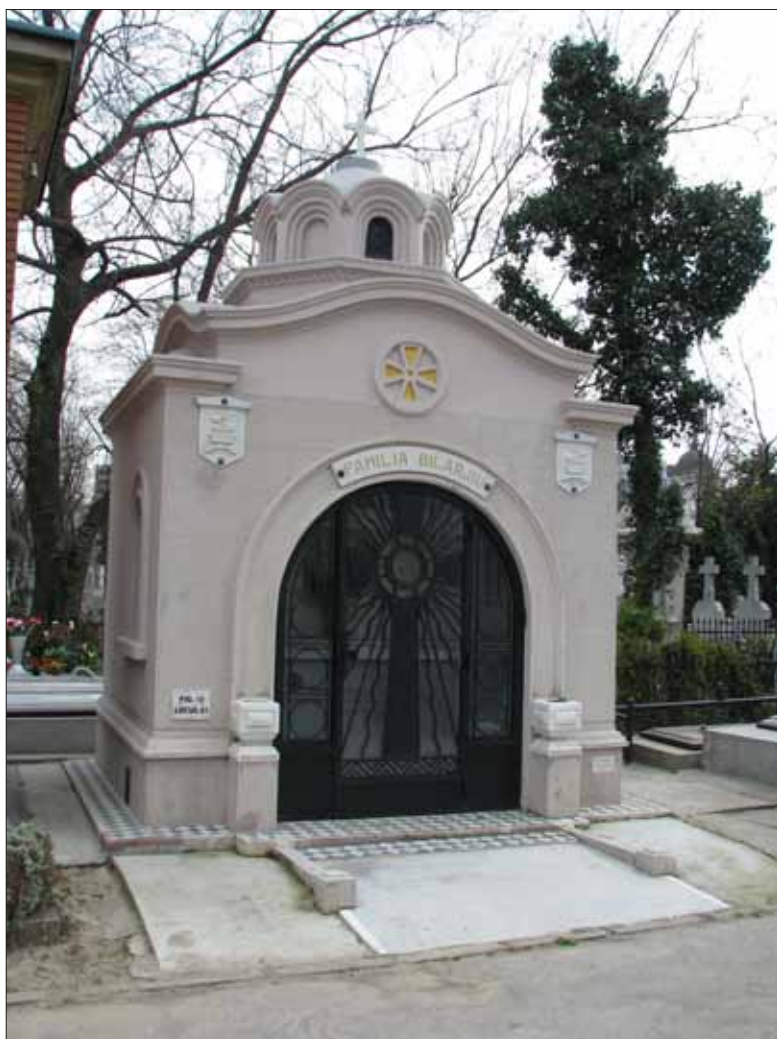
Fig. 18. Cavoul arhitectului Bilarjiu