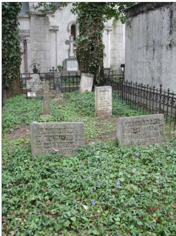
Fig. 12. Ansamblul funerar al familiei Balș