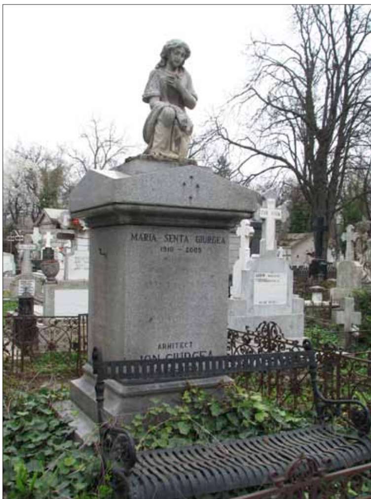
Fig. 3. Monument funerar Ion Giurdea