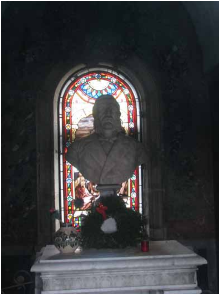
Fig. 7. Bust în interiorul cavoului Dobre Nicolau