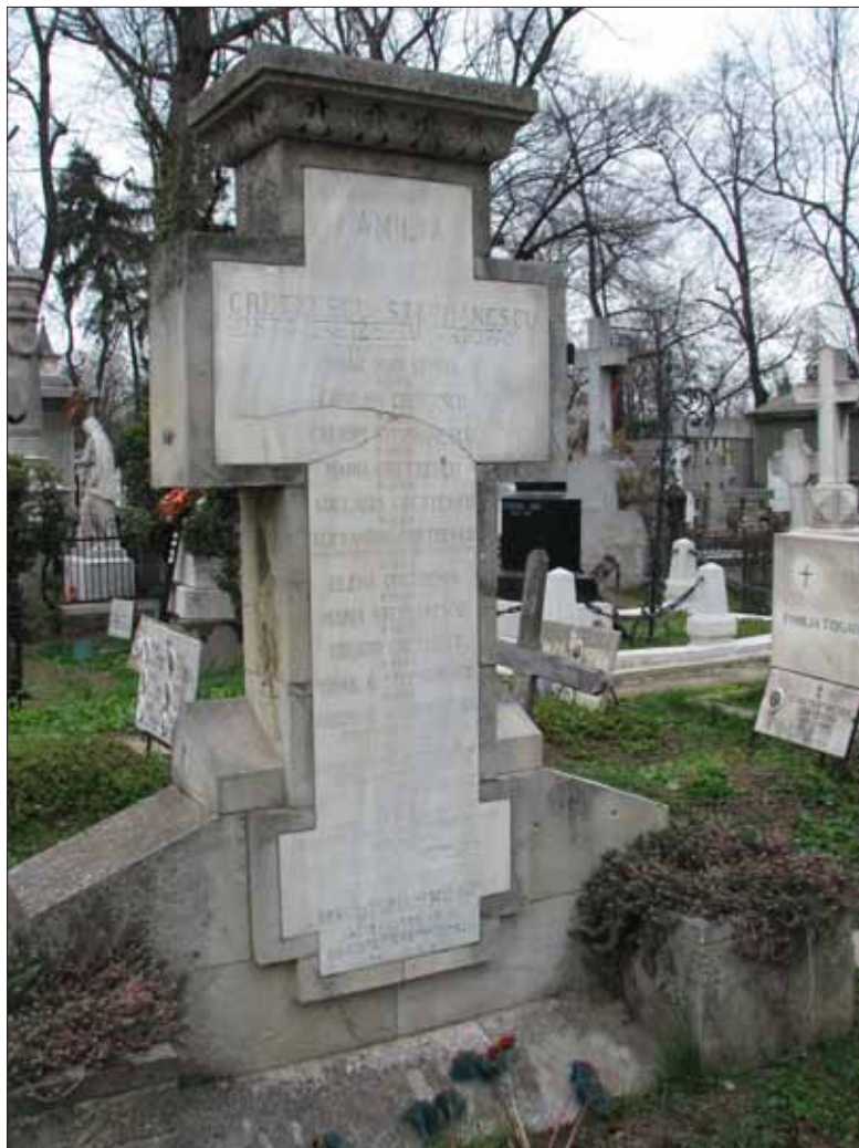
Fig. 19. Crucea lui Victor Ștephănescu