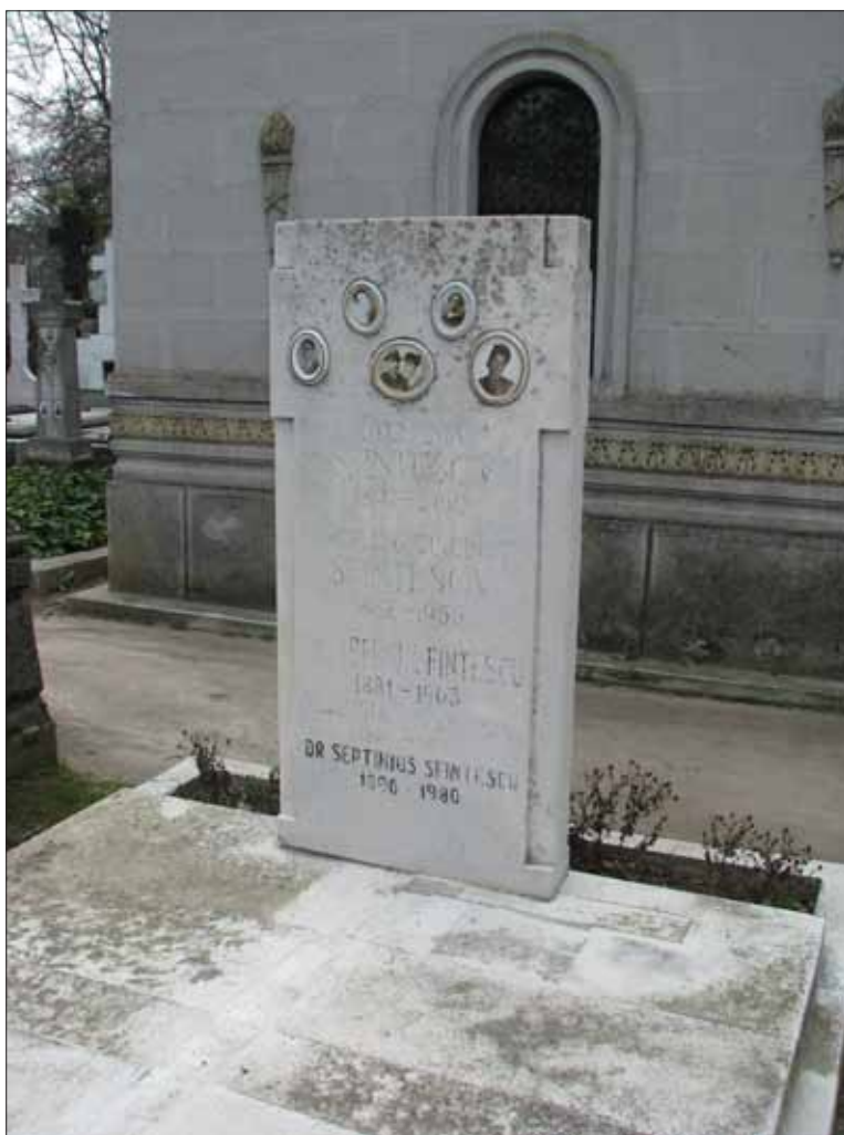
Fig. 5. Stela funerară a profesorului Cincinat Sfințescu