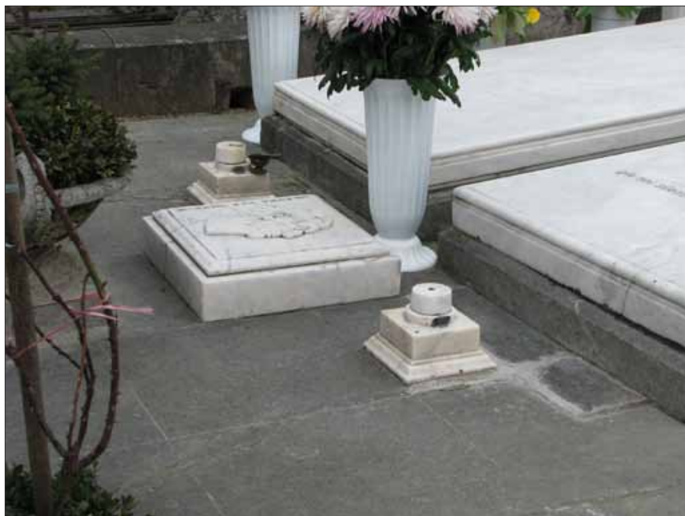
Fig. 2. Medalion Edmond van Saanen Algi