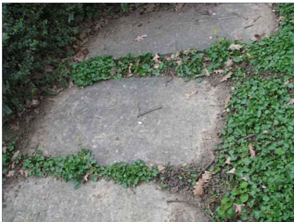
Fig. 16. Lespezile mormintelor familiei Ghica-Budești