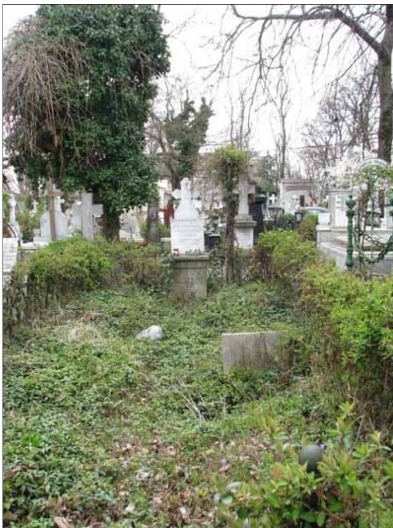
Fig. 15. Locul funerar al familiei Socolescu