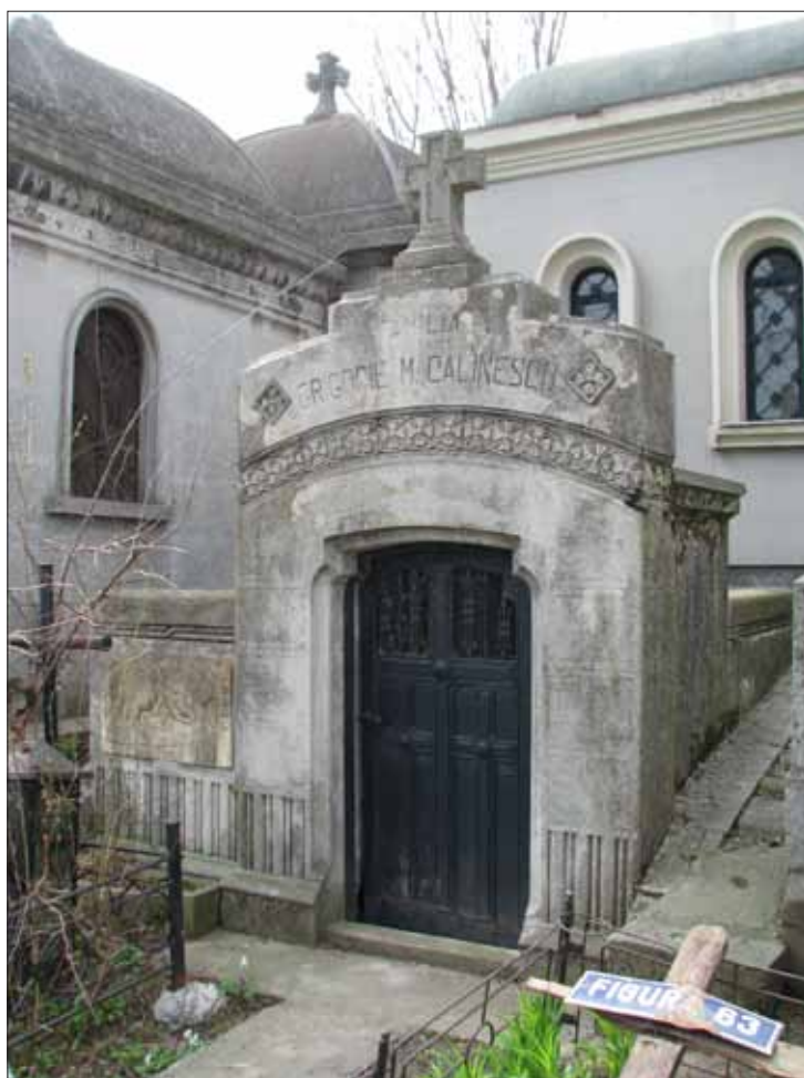
Fig. 10. Cavoul familiei arhitect Grigorie Călinescu