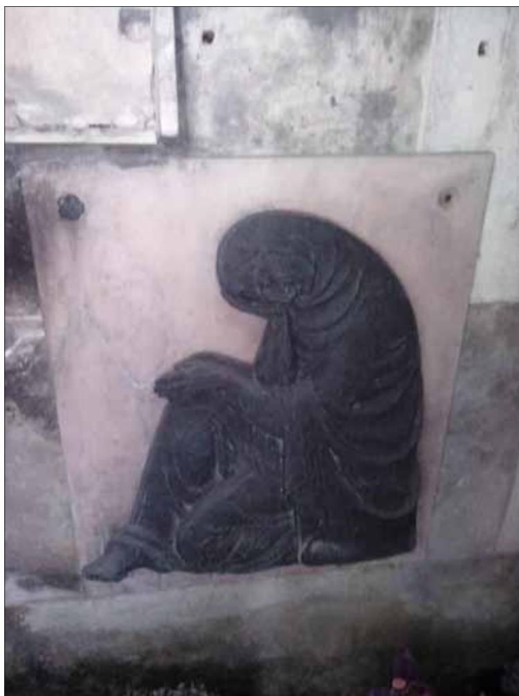
Fig. 4. Basorelief semnat de Boris Caragea în interiorul piramidei Pompilian