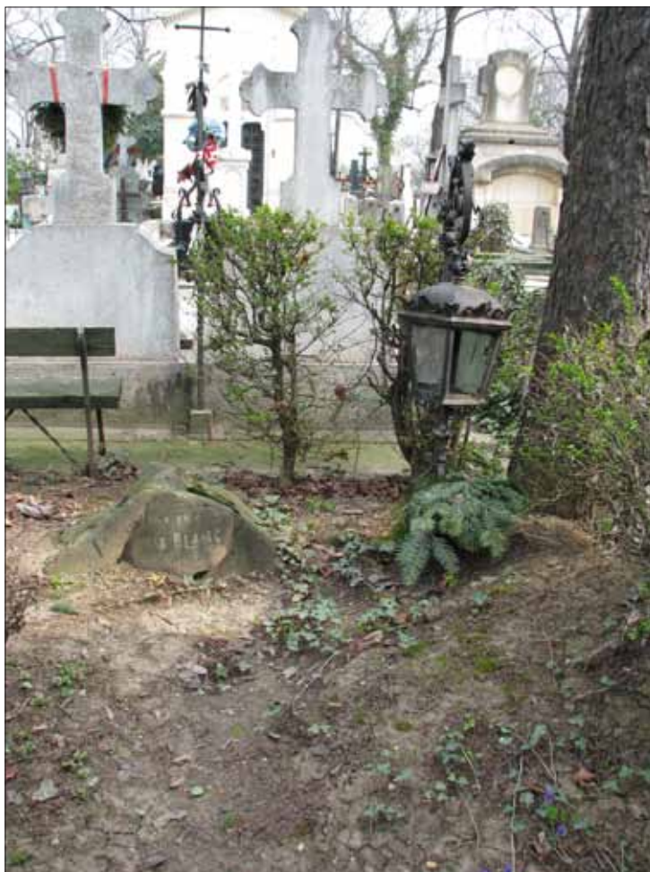
Fig. 9. Piatra de mormânt a lui Louis Blanc