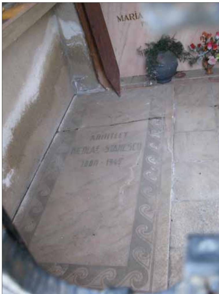
Fig. 13. Lespedea mormântului lui Nicolae Stănescu