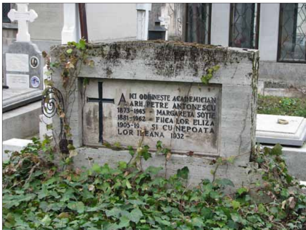
Fig. 14. Stelă funerară la mormântul lui Petre Antonescu