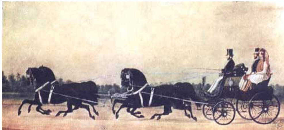
Fig. 3. Beizadea Grigore Ghica , fiul domnitorului Grigore IV Ghica, plimbându-se la Șosea. Acuarelă, 1845