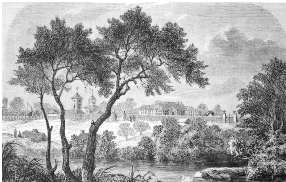
Fig. 4. Casele Ghica de la Colentina , tipăritură, sec. XIX