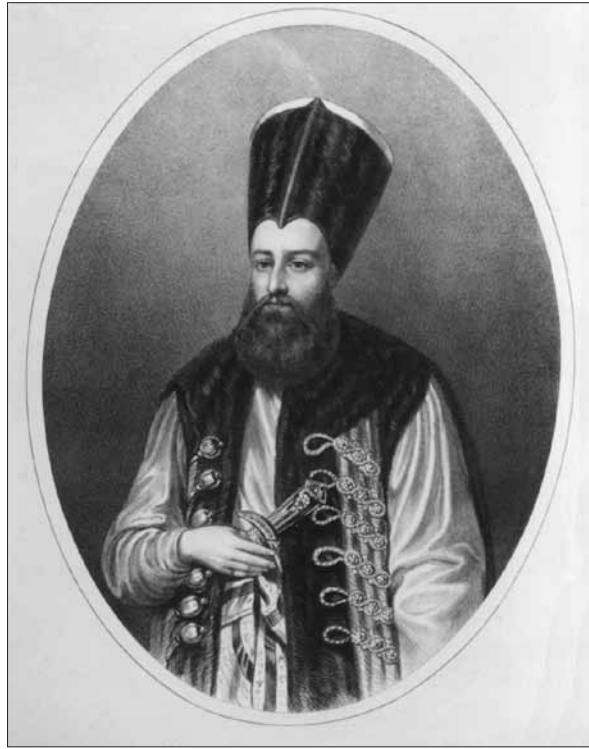
Fig. 1. Grigore IV Ghica , litografie, secolul XIX