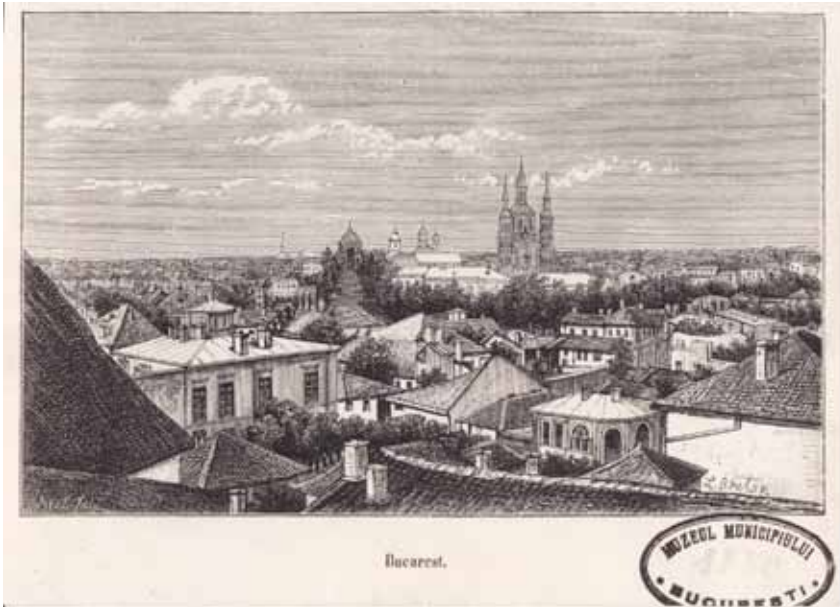
Fig. 1. L. Buton, Vedere generală a Bucureștiului în secolul al XIX-lea, litografie, patrimoniul MMB.