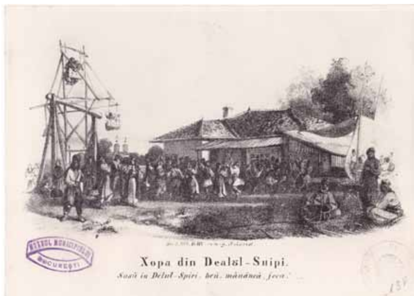
Fig. 4. Horă și „dulap” în Dealul Spirii, litografie, patrimoniul MMB.