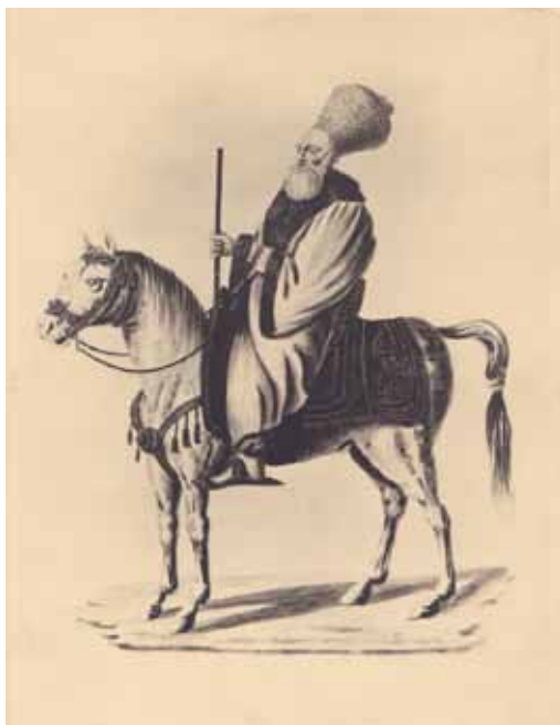
Fig. 2. Boier român, fotocopie, patrimoniul MMB.