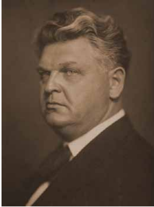
Fig. 5. Mihail Sadoveanu