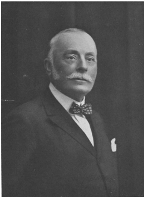
Fig. 3. Alexandru Marghiloman