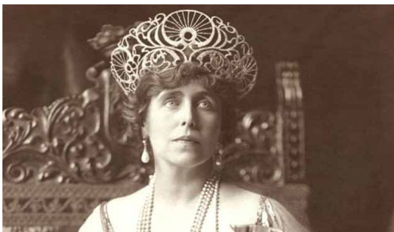
Fig. 4. Regina Maria