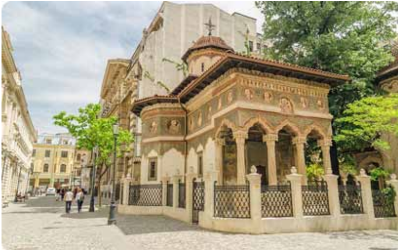
Fig. 6. Biserica Stravropoleos