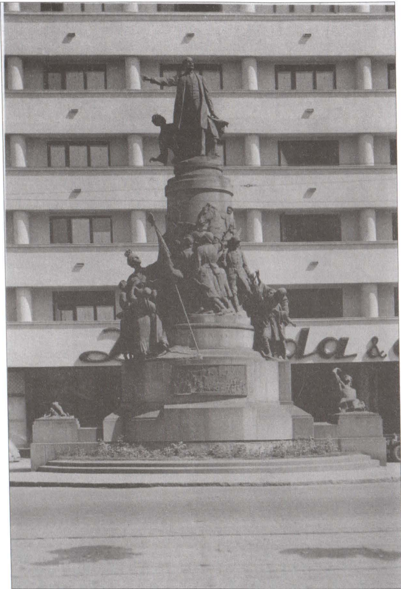
București, Monumentul Tache Ionescu