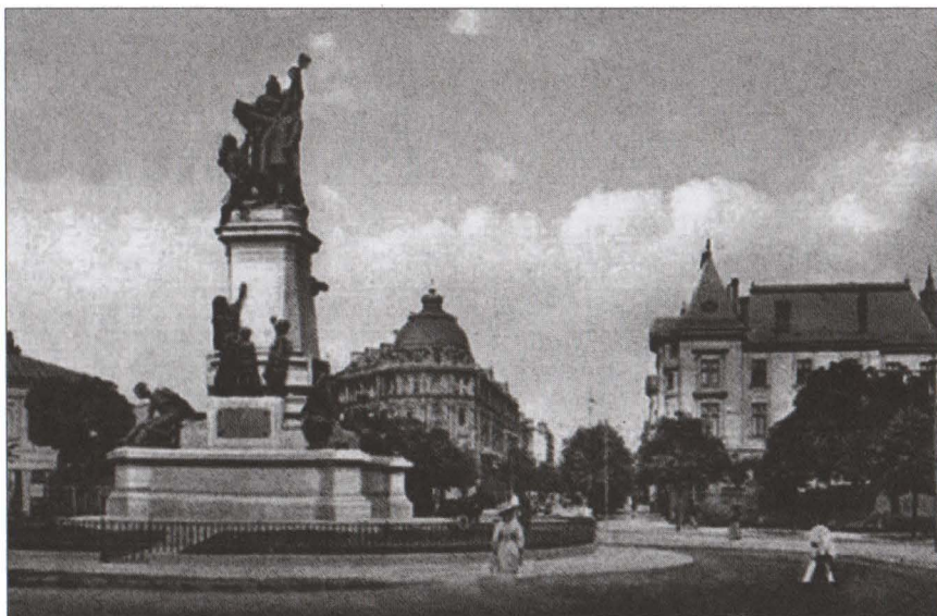
Fața vestică a monumentului Ion C. Brătianu.