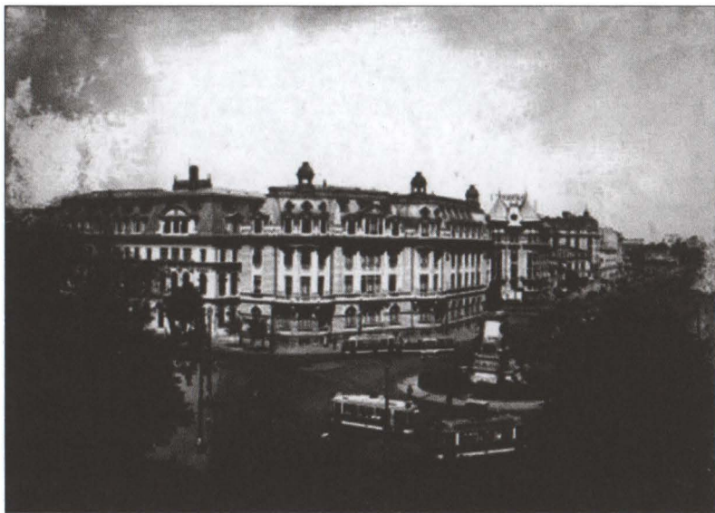
Componentele care au fost integrate fațadei cu deschidere spre nord-est.