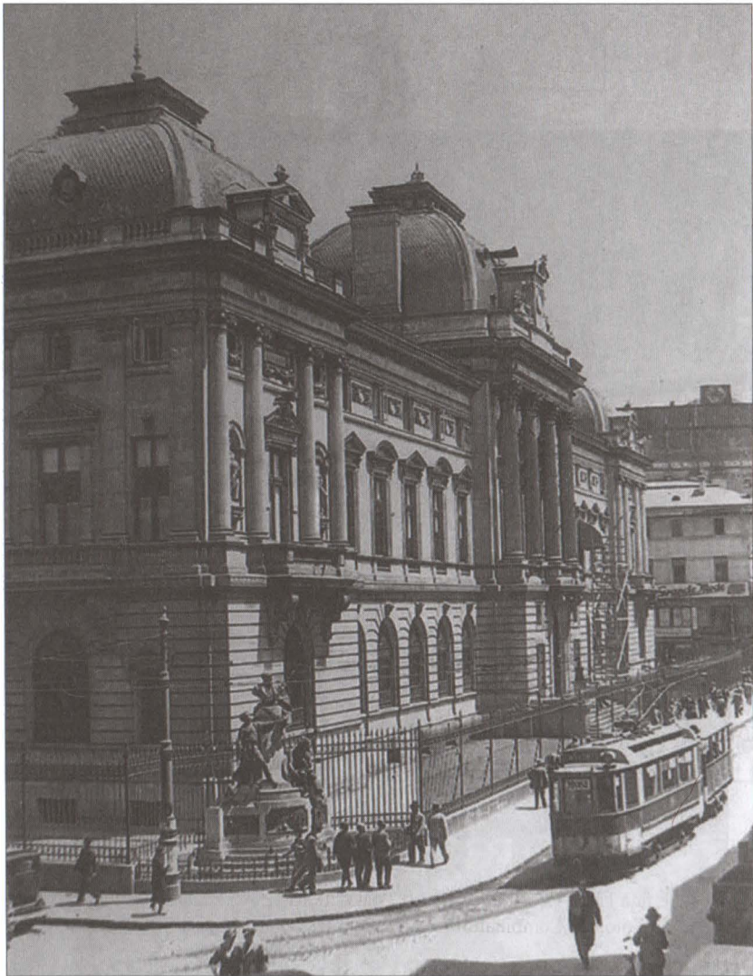
București, alveola din curtea B.N.R. la intersecția străzilor Lipscani și Eugeniu Carada unde în 1924 a fost dezvelit monumentul dedicat cinstirii finanțistului Eugeniu Carada, lucrare concepută și modelată de sculptorul Ernest Dubois, montată în România de către fostul său elev Dimitrie Mățăuanu.