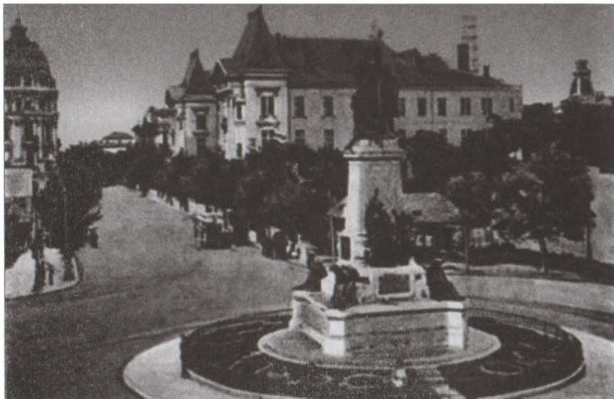
București, la intersecția celor două mari axe rutiere ale Capitalei amplasamentul monumentului Ion C. Brătianu. Componentele care au fost integrate fațadei cu deschidere spre est.