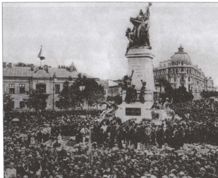
București, 1903 – solemnitatea inaugurării monumentului Ion C. Brătianu