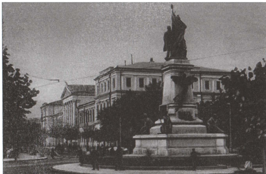
Componentele care au fost integrate fațadei cu deschidere spre vest.