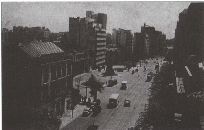
Ambientul în care a fost amplasat monumentul Tache Ionescu