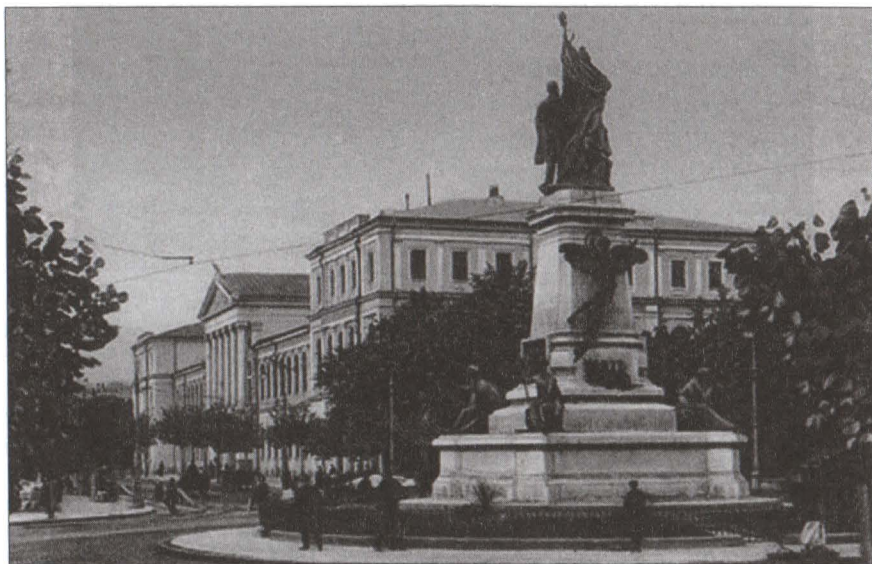
Fața estică a monumentului Ion C. Brătianu.