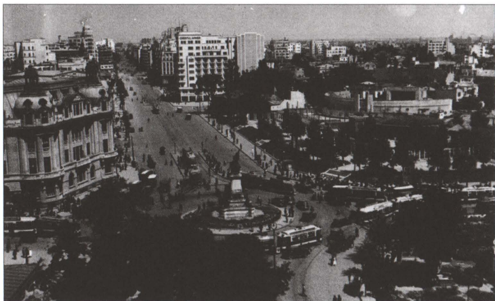
Monumentul Ion C. Brătianu cu deschidere spre zona nordică a bulevardului În partea stângă fragmentar Palatul Universității, în dreapta se poate remarca prezența « Panoramei » care în deceniul al patrulea al veacului trecut găzduia manifestărilor artistice fie ale Tinerimii Artistice, fie ale Salonului Oficial. În dreptul străzii Batiștei clădirea « Creditul Minier »