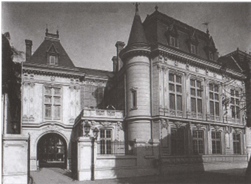
Monumentul fusese amplasat în imediata apropiere a casei Tache Ionescu Edificată la 1888 = ?