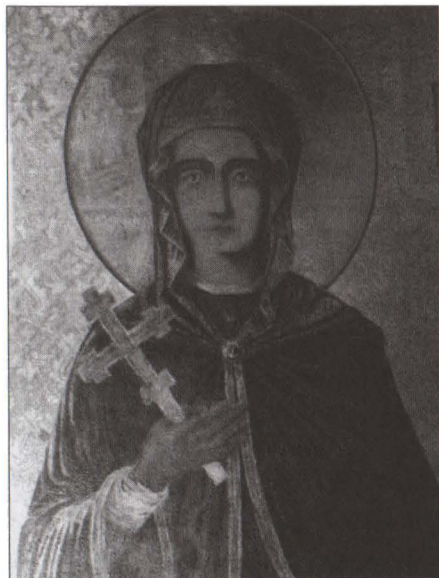
Fig. 3 detaliu din portretul icoanei sfintei Parascheva