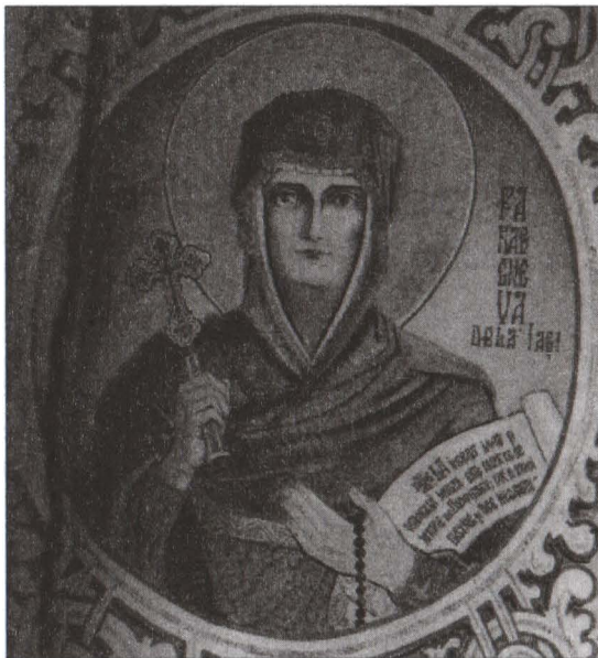
Fig. 4 detaliu din icoana Sfântei Parascheva de la Iași, icoană aflată în biserica Sfântul Anton din București