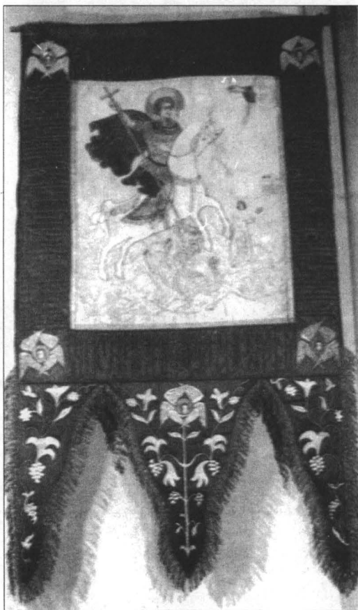
Steag din timpul lui Ștefan cel Mare