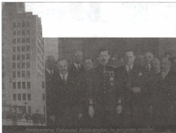
Carol al II-lea la inaugurarea Palatului Telefoanelor

Într-o Europă a dictaturilor, Germania și Italia fiind elocvente, în conformitate cu propriile sale concepții politice, Carol al II-lea a considerat că este momentul instaurării proprii sale dictaturi. Unii istorici apreciază că la acest deziderat acționase încă de