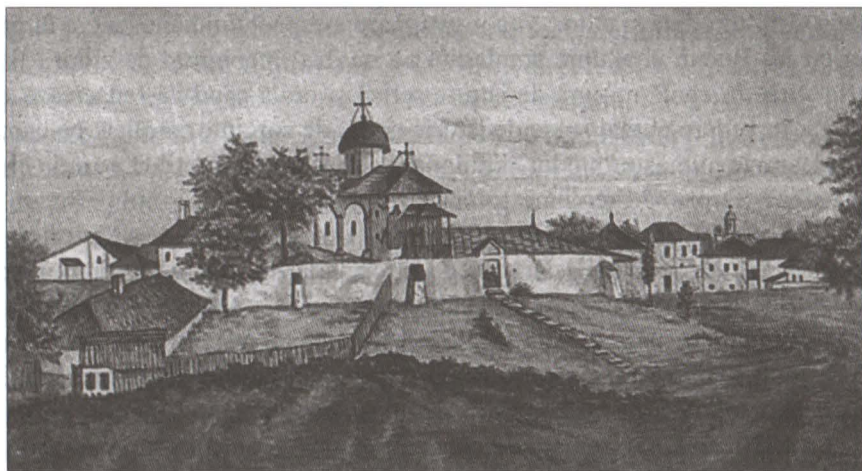
Biserica Bucur la 1856

Biserica zisă “a lui Bucur Ciobanul” ori “Biserica Sf. Atanasie ce este afară de curtea Mănăstirii [Radu Vodă]” așa cum apare într-o catagrafie datată 1 mai 1853 1 este conform unei legende ctitoria ciobanului Bucur, fondatorul orașului București pe malul unei ape curgătoare, în locuri numai bune de pășunat. Prima mențiune scrisă a legendei lui Bucur și a ctitoriei sale apare în cartea istoricului sas Johann Filstich, “Tentamen Historiae Vallachicae” 2 publicat în 1728. În Cartea I, capitolul V e scris