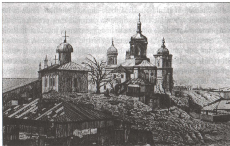
Biserica Bucur și Mănăstirea Radu Vodă la 1881, după dărâmarea zidului de incintă mănăstiresc

În ceea ce privește stilul arhitectural al lăcașului, acesta se încadrează tipologic după specialiști 12 veacului fanariot, cu precizarea că forma acoperișului turlei e unică din punct de vedere constructiv printre ctitoriile similare din capitală; transpunerea canoanelor arhitecturale ortodoxe în cărămidă și piatră s-a făcut în cazul acestui lăcaș de cult cu economie de mijloace, o posibilă indicație a rolului său marginal în viața comunitară monahală. Astfel e vizibilă, de pildă, substituția pronaosului prin pridvorul de lemn andosat fațadei principale și o deplină refuzare a oricărui element de podoabă, ab initio , de exemplu ciubucul sculptat de pe fațadă și ancadramentele sculptate ale ferestrelor; actualele ancadramente datează din anul 1910, fiind datorate atenției la detalii a arhitectului-restaurator Grigore Cerkez. Tencuiala albă care e