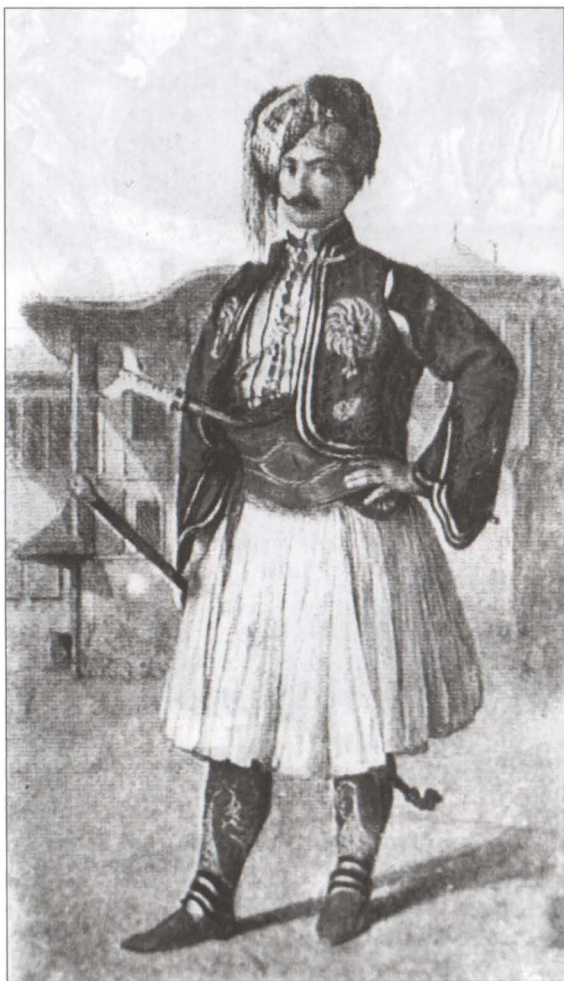
C. Stöckler, Arnăut Litografie, sec. XIX