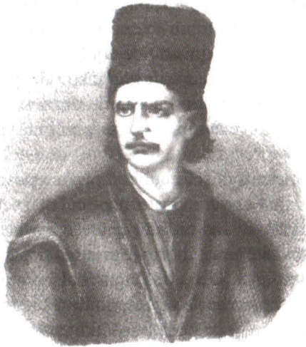
Tudor Vladimirescu Litografie, sec. XIX