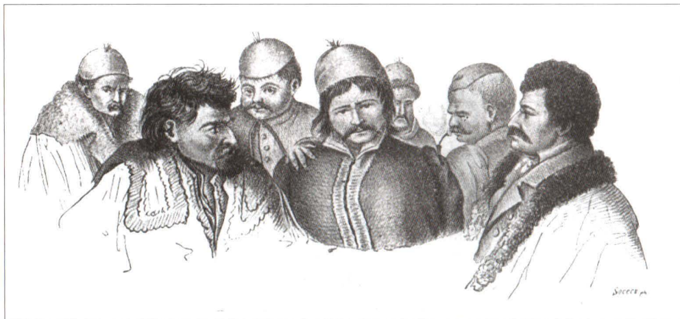
Soldați eteriști de la 1821