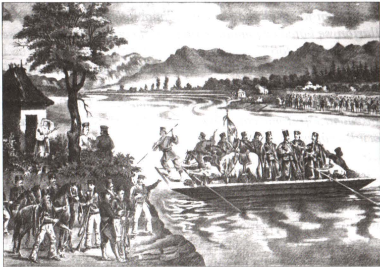
Panduri trecând Oltul la 10 martie 1821 Litografie, sec. XIX