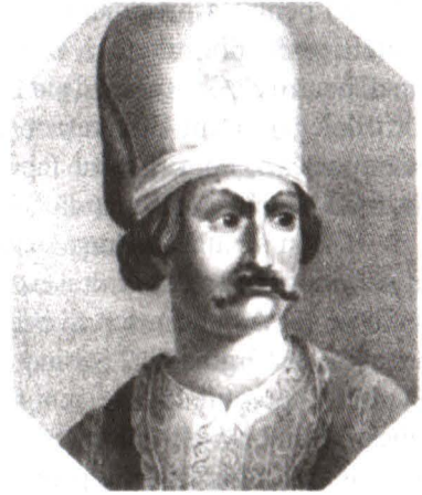
Alexandru Ipsilanti Aquatorte, sec. XIX