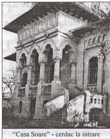
“Casa Soare” - cerdac la intrare

La etaj se aflau alte săli de studiu pentru copii, dormitoare pentru musafiri, camere destinate personalului de serviciu și anexe.