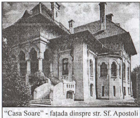
“Casa Soare” - fațada dinspre str. Sf. Apostoli

În jurul holului central de la parter erau dispuse vestibulul, biblioteca, salonul, salonașul, sufrageria cu oficiile anexe, precum și dormitoarele părinților și cele ale copiilor, cu încăperile de toaletă.