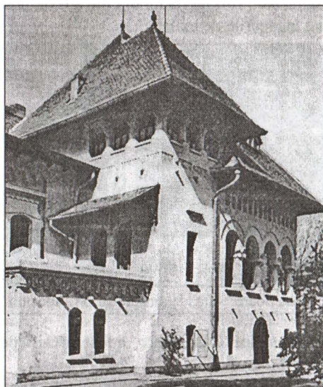
“Casa Soare” - fațada dinspre str. col. Poenaru-Bordea

Clădirea, cu destinație mixtă – locuință și sediu de întreprindere particulară, a fost înălțată pe un teren de 3012 m.p. în formă aproape pătrată, astfel încât fiecare dintre laturile sale să poată constitui câte o fațadă deschisă spre străzile Apolodor, Col. Poenaru Bordea și Sf.