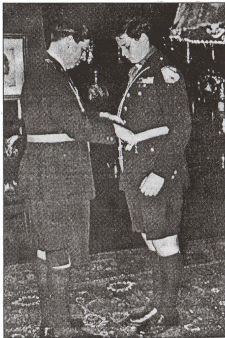
Regele Carol al II-lea și Mihai în uniforme de străjeri

Oficialilor de stat li se acordă timp special, ca să poată fi prezenți la aceste cursuri sau manifestări.