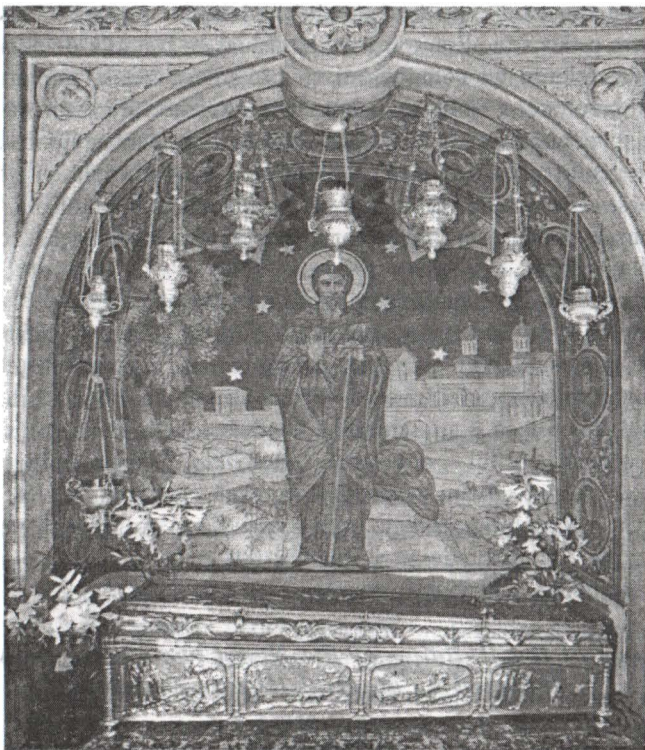
Racla Sfântului Dimitrie cel Nou – Catedrala Patriarhală

Nu puțini sunt cei care calcă pragul sfintei Catedrale a bătrânei Mitropolii, pentru a înălța rugăciuni către Dumnezeu, la racla Sfântului Dimitrie cel Nou, ale cărui sfinte moaște, întregi, ocrotesc cu strășnicie, de mai bine de două veacuri, capitala plaiurilor noastre românești, București. Puțini sunt însă cei care știu că acesta este considerat și ocrotitorul Bucureștilor.