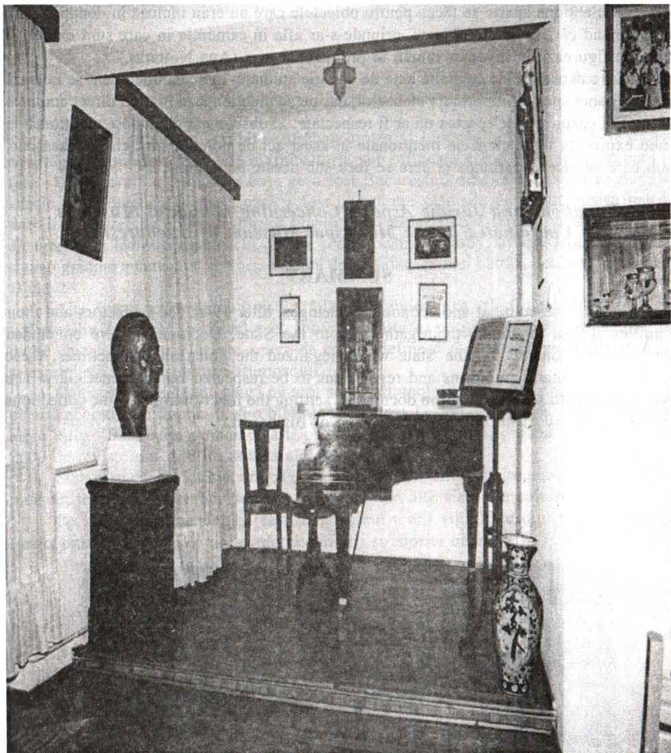
Muzeul „C. I. și C. C. Nottara”