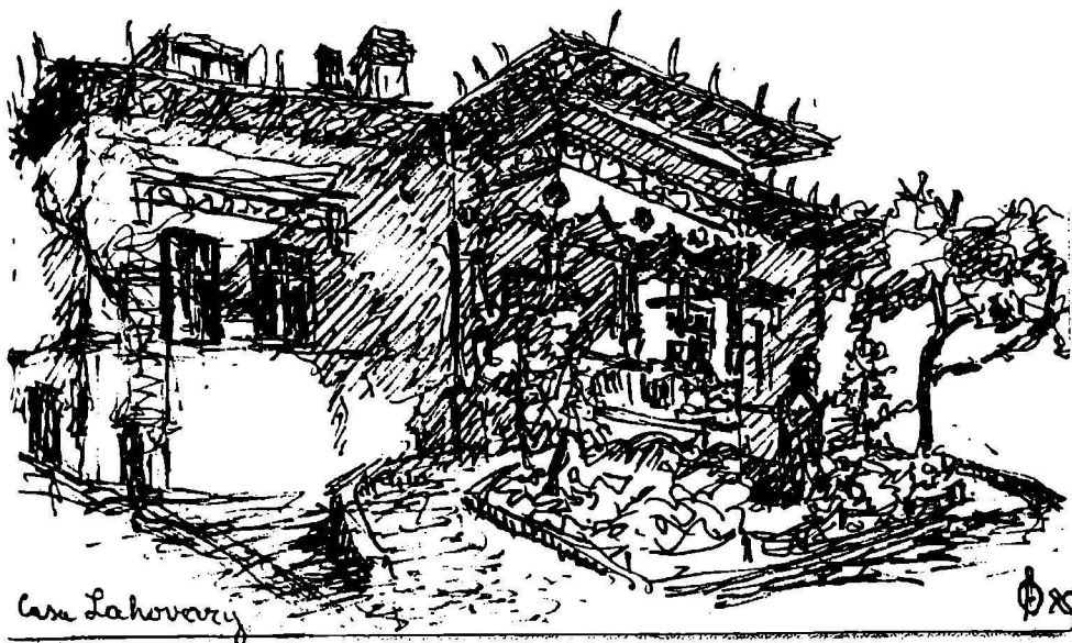
Desen de Alexandru Olian

În 1885, pe atunci colonelul Lahovary, mai târziu general conservator, îl roagă pe arhitectul Mincu să-i facă o casă în stil românesc. Dragostea lui Mincu pentru biserica Stavropoleos, îl face să folosească elemente ale acestui monument pentru Casa Lahovary și „Bufetul” de la Șosea. Pe la sfârșitul anului 1886 casa este gata. Prin ea, a biruit stilul național în arhitectură. Succesul a fost enorm. Lucrarea produce senzație în cercurile