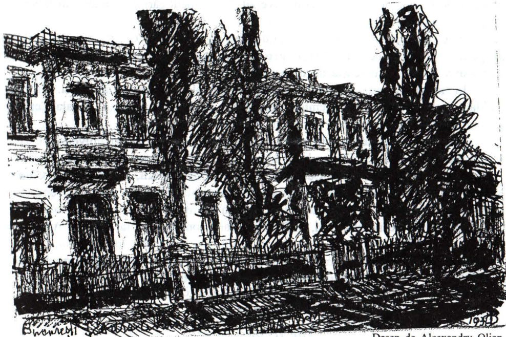
Școala Centrală de fete (arh. Ion Mincu)

De curând s-au împlinit 150 de ani de la înființarea Școlii Centrale, la început „Pensionatul Domnesc de Demoazele” 1851, proiect materializat de domnitorul Barbu Știrbey (1849–1856).