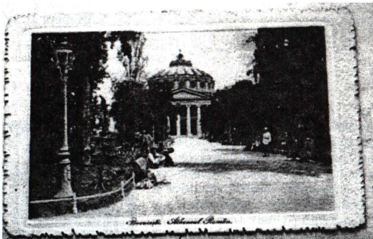
Carte poștală: Ateneul Român și grădina Ateneului la începutul sec. XX; Colecția Muzeului Municipiului București.

Sediul inițial al societății se afla într-un salon al Ministerului Instrucțiunii Publice, în casa prințului Ghica de lângă Cișmigiu. Societatea avea însă nevoie de un sediu propriu. Construcția acestuia a început să preocupe pe membrii societății și mai ales pe Constantin Esarcu odată cu testamentul lui Scarlat (Carol) Rosetti, din anul 1870. În testamentul său, acesta cere ca din vânzarea celor două case ale sale lăsate moștenire Ateneului să se strângă suma necesară în vederea construirii unui edificiu pentru o bibliotecă, al cărei fond inițial de carte urma să fie propria sa bibliotecă care cuprindea în jur de 5000 de volume. La fondul lichid Rosetti s-au adăugat și altele, s-au inițiat colectări de fonduri sub deviza: „Dați un leu pentru Ateneu”, s-a organizat o loterie (1886).