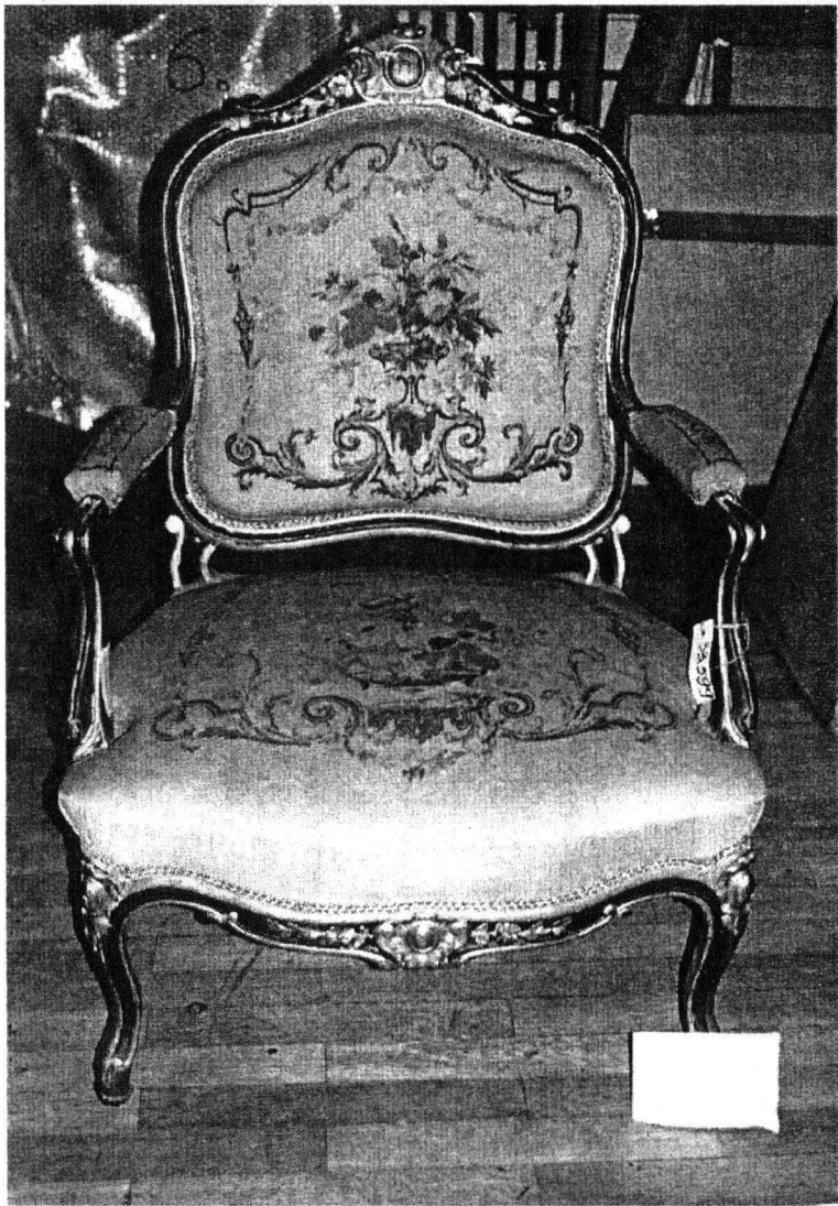
Foto nr. 1 Fotoliu Napoleon III sec. XIX.