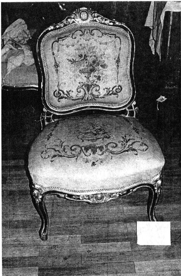
Foto nr. 2 Fotoliu Napoleon III sec. XIX.