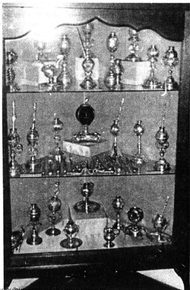
Muzeul de Istorie al Oraşului Buenos Aires general „Cornelia de Saavedră