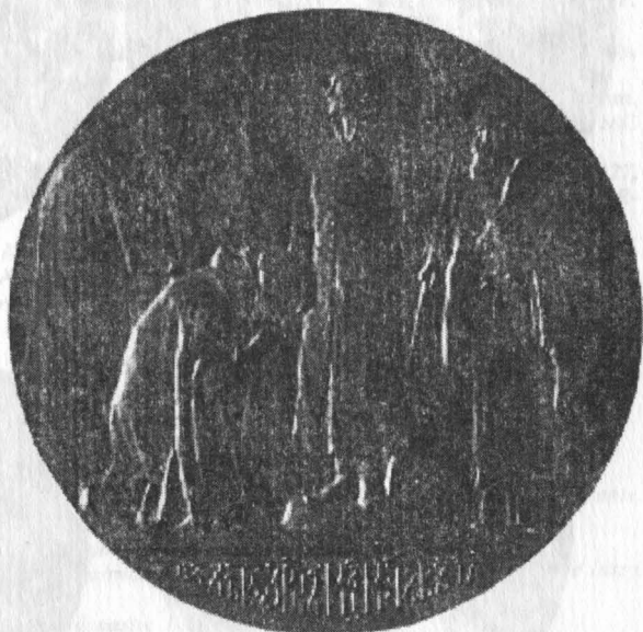
4. Medalie rombică, reclădirea bisericilor Sf. Nicolae și Trei Ierarhi din Iași, 1904.