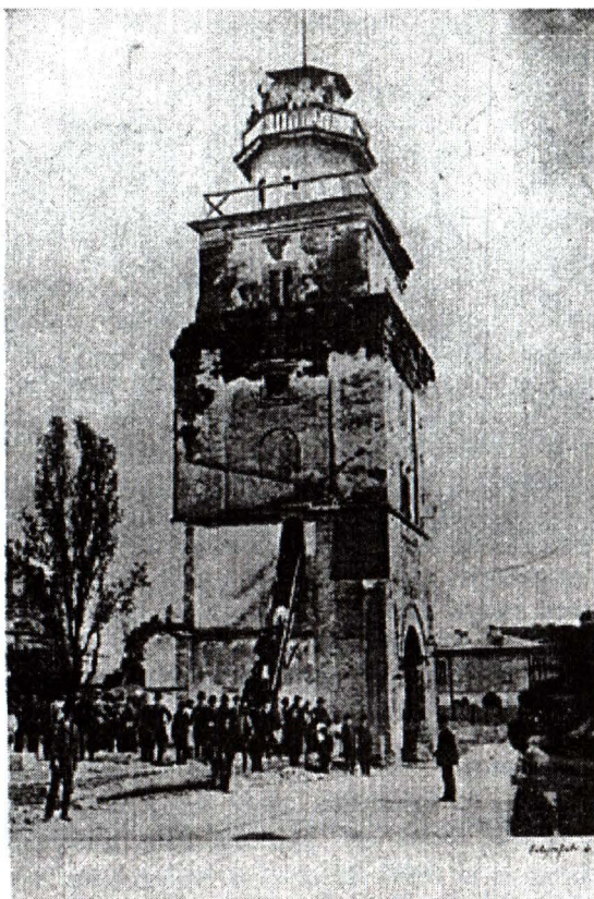
Turnul Colței în anul premergător dărâmării lui.

Probabil pentru veacul al XVIII-lea, George Costescu menționează o altă mahala, redusă ca habitat, „în spatele Colței” (a spitalului și a hanului omonim). Este vorba despre „potcovarii”, fierarii, „rămași acolo de pe vremea hanurilor