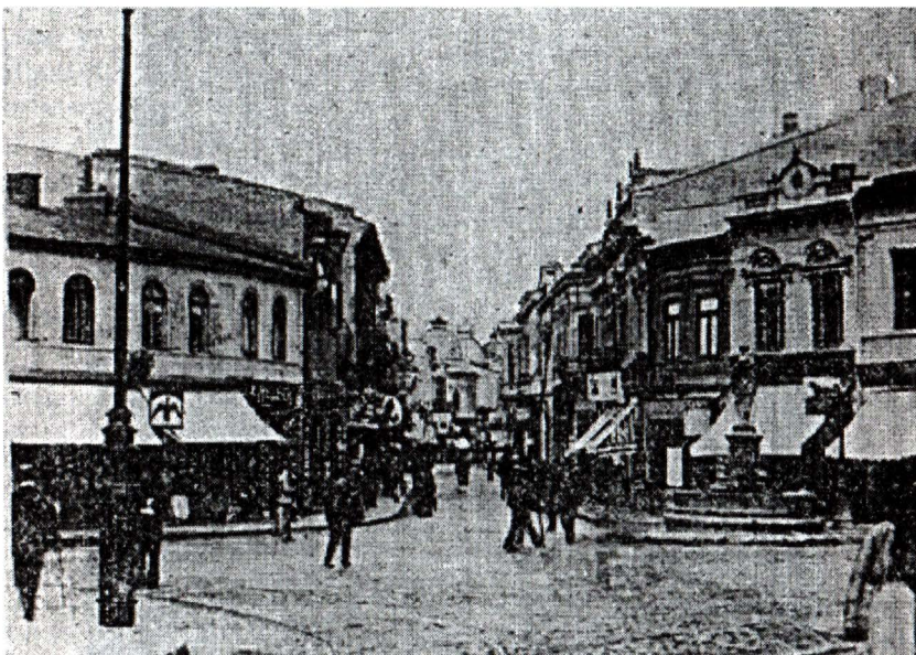
Strada Lipsanilor, văzută din Piața Sf. Gheorghe-Nou. La dreapta, unul din vechile „avuzuri” de răspântii.

(Bucurest, 1907), Nicolae Iorga, Istoria Bucureștilor (București, 1939), George Costescu, Bucureștii vechiului regat , (București, 1944), Constantin Giurescu, Istoria Bucureștilor (București, 1976); studiile revistei de Materiale de Istorie și Muzeografie , publicate anual din 1964 de M.I.A.M.B.; volumele Documente Bucureștene privitoare la proprietățile mănăstirii Colțea publicate în 1941 de Ion Ionașcu și Începuturi edilitare 1830–1832 , publicat într-un prim volum în 1936 în București. Adaug selectiv din variatele lucrări cu specific de istorie bucureșteană: George Potra, Din Bucureștii de altă dată (București, 1941), Alexandru Lepădatu, Catagrafia Biseriilor Bucureștene (București, 1907), Constantin Moisil, Bucureștii vechi. Schiță istorică și urbanistică (București,