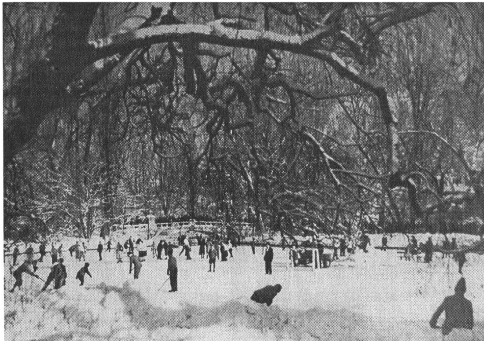
Patinaj pe Lacul Cișmigiu, 1933.

Cișmigiul cu aleea de trandafiri și arbori seculari era loc favorit de plimbare al bucureștenilor în timp de vară pentru decorul lui variat și colorat, plin de verdeață și răcoare. Este deschis în această perioadă un restaurant cu nume exotic, Monte Carlo . Exista în Cișmigiu și un pavilion de ape minerale pus la îndemâna celor care nu-și puteau permite să plece la o cură de băi în afara Bucureștiului.