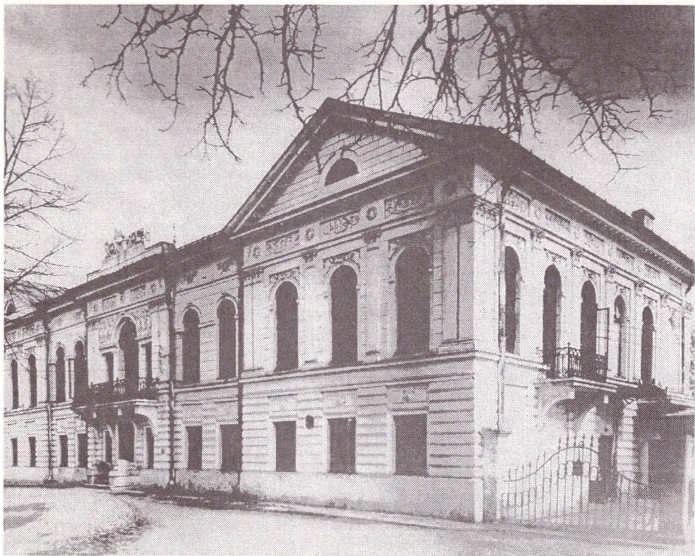
Palatul Ghica-Tei, reședința de vară a voievodului Grigore al IV-lea Ghica

În fine, documentele ni-l amintesc pe Karl Storck, cel care la 17 noiembrie 1863 a fost însărcinat să transforme interiorul edificiului casei Șuțu; deschiderea arcadelor, crearea scării monumentale, sculpturi în lemn etc. 75 . Și astăzi, după decenii și decenii, arta și măiestria sculptorului și artistului decorator Storck este neîntrecută, căci el a reușit să confere ansamblului interior al palatului, o ambianță și maiestruozitate deosebită.