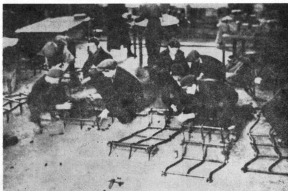
3. Muncitorii de la Uzinele Malaxa din București repară unelte agricole (primăvara anului 1945).

— să nu rămână neînsămîntată. Acest fapt a consolidat „frățietatea” muncitorilor, țăranilor și actul înalt de dreptate socială și națională săvîrșit prin reforma agrară 55 .