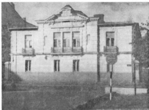
1. Casa Trubetzkoj-Nenciu (starea actuală, 1871).

timplată în 1808, deveni proprietarul casei părintești, aflată pînă nu de mult în fața actualiei săli Comedia a Teatrului Național.