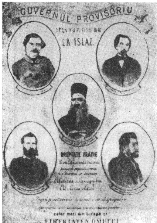
Fotografiile membrilor Guvernului Provizoriu publicate la Craiova în 1894. Lipsește Gh. Magheru.

acolo. Dar cu toate că din această lucrare se pot căpăta multe informații, ea este redactată fără prea mare precizie. Relatarea lui E. Chinezu, este în contradicție cu cea a lui Eliade. Or, noi înclinăm să considerăm adevărată relatarea lui Eliade, acesta fiind participant la acest eveniment. Așa cum arată în lucrarea amintită, Magheru se afla la acea dată