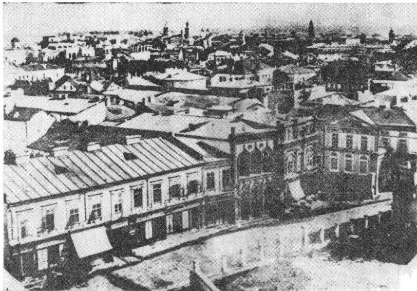
Fig. 3 — Podul Mogoșoaiei în Piața Teatrului Național la 1856

toate probabilitățile era o cafenea. Avem astfel o imagine rară, dacă ținem seama că aceste cafenele roiau îndeosebi, în jurul curții domnești în vecinătatea imediată a căreia se afla Piața de Flori.