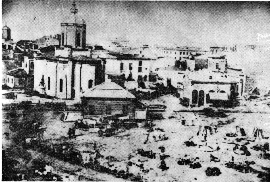
Fig. 1 — Piața de flori cu cafenea

supărări. Aceleași mori împiedicau curgerea ei normală. De aceea, în 1865 morile de pe Dîmbovița au fost desființate printr-un decret al lui Mihail Kogălniceanu. Valoarea fotografiei — constă în aceea că ne înfățișează Dîmbovița înainte de canalizare cu clădiri care mai păstrează elemente orientale în arhitectura lor și lucru cu totul nou — existența unui pod de piatră — semn al continuei modernizări.