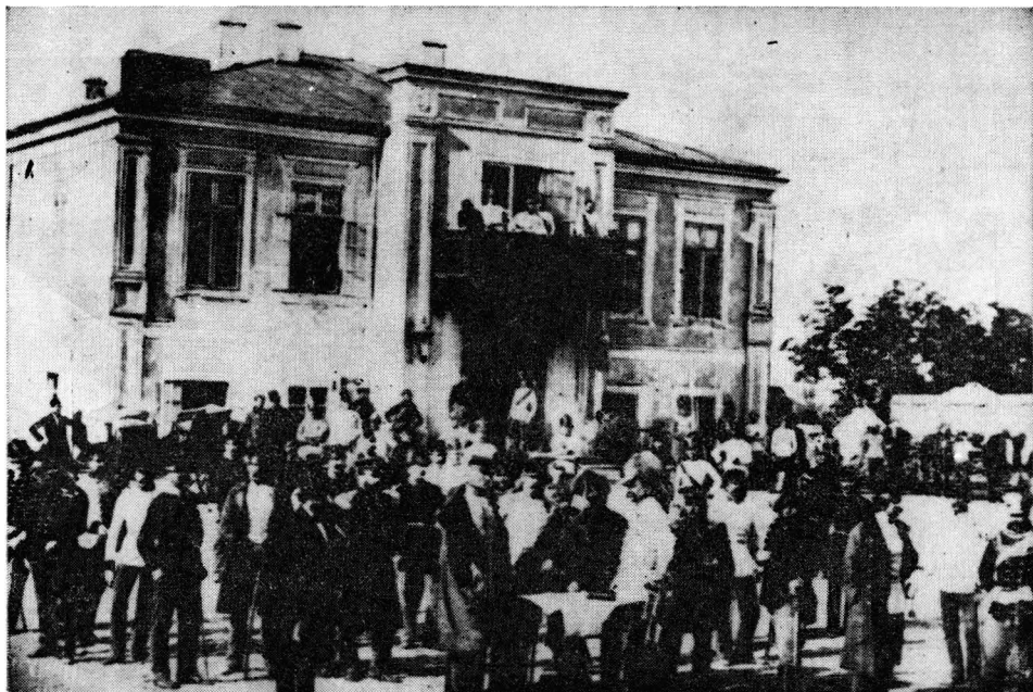
Fig. 4 — Casa Meitani

Unul dintre acesta a fost cel din apropierea Podului Mihai Vodă, în spatele Casei Apelor 9) , surprins în imaginea lui Angerer. Din aceeași perioadă — mijlocul secolului XIX — este cunoscut încă un foisor, acela din turnul Colței.