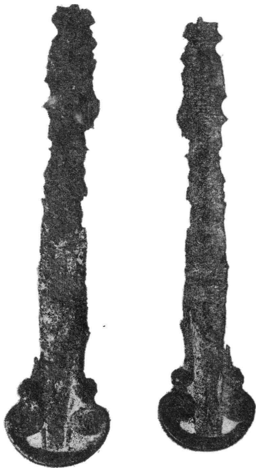
Fig. 1 — Spada celtică de la Săcueni

spadei, descoperirea a survenit între anii 1928—1935, fragmentul aflat la M.I.B. rămîne în țara noastră singurul martor al grupului de morminte celtice de la Săcueni.